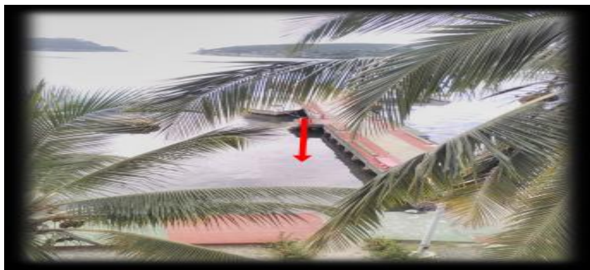
Figura 6. Punto de muestreo 5. Playa Punta Gorda

de pH, como los de nitrito y amonio, resultan muy similares a los obtenidos en los anteriores puntos de muestreo (tabla 1). No obstante, el contenido de nitrato supera los 4 mg/L como en el caso de la base de pesca El Níspero (punto 2).