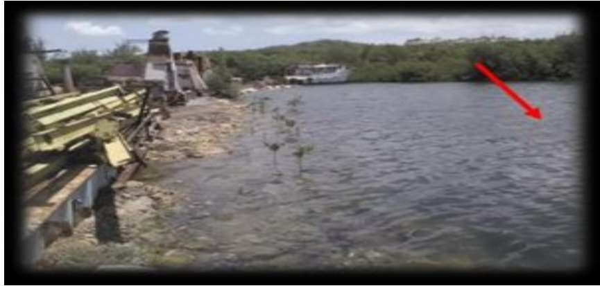
Figura 4. Punto de muestreo 3. Astilleros DAMEX

El oxígeno disuelto es superior a los puntos anteriores (4,4 mg/L) y los valores de DBO 5 y DQO (66,5 y 208 mg/L respectivamente) son menores que en la base de pesca (punto 2), pero superiores a los alcanzados en las muestras de la playa (punto1). En este caso, también, el pH y el nitrito cumplen la norma NC 22:1999 y el oxígeno disuelto se encuentra próximo a los límites establecidos para agua de calidad en zona de baño.