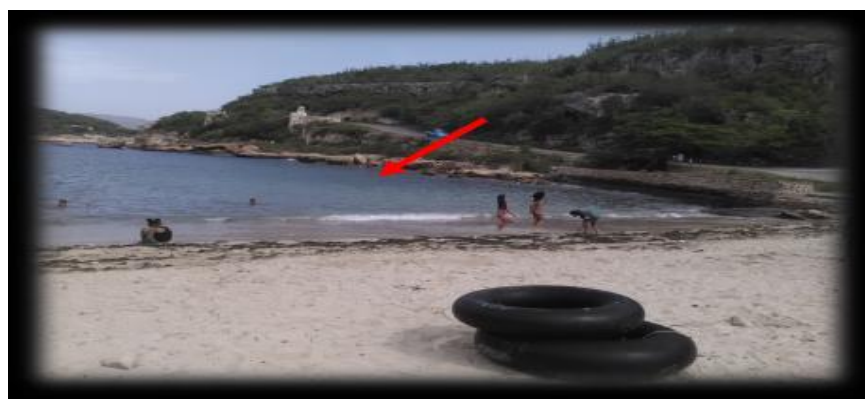
Figura 2. Punto de muestreo 1. Playa La Estrella

En la tabla 1 se presentan los valores medios obtenidos de los análisis químicos realizados a los cinco puntos que se analizan en esta parte inicial. Se puede apreciar que los valores de pH obtenidos para el punto 1 son ligeramente alcalinos, el contenido de nitrógeno en cualquiera de sus formas no supera los 2 mg/L y el de fosfato, es inferior a 1 mg/L. Además, se observa que, a pesar de existir un elevado contenido de sólidos suspendidos, la turbiedad no alcanza el valor de 1 NTU e indica que la transparencia del agua de mar en ese punto no se ve afectada. El contenido de oxígeno disuelto (OD) es de 3,6 mg/L con valores de DBO 5 y DQO de 86 y 264 mg/L, respectivamente. Sin embargo, de todos los parámetros presentados en la tabla, sólo el pH y el nitrito cumplen con las características de agua de buena calidad para la zona de baño que establece la norma NC 22:1999.