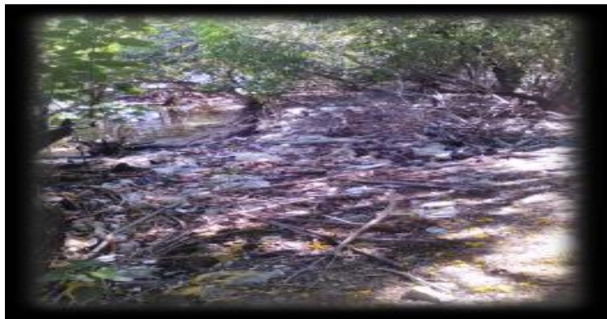
Figura 8. Acumulación de basura en la zona