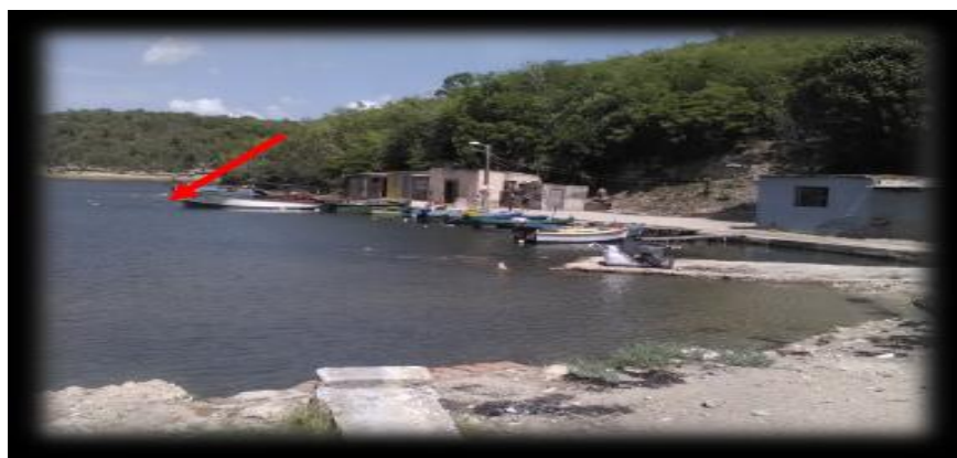
Figura 3. Punto de muestreo 2. Base de pesca El Níspero

Se puede observar (tabla 1) que el pH se presenta ligeramente básico, en norma, similar al punto anterior; el fosfato posee un valor de 1,24 mg/L y el contenido de sólidos suspendidos es elevado, incluso superior al punto de muestreo de la Estrella, aunque la turbiedad no alcanza el valor de 1 NTU. El oxígeno disuelto es 4,2 mg/L, con valores de DBO 5 y DQO de 61,5 y 192 mg/L respectivamente. El nitrógeno como nitrito y amonio no alcanza un valor de 0,1 mg/L, sin embargo, el nitrato es de casi 5 mg/L. El nitrógeno es un nutriente importante para el desarrollo de animales y plantas acuáticas. Por lo general, en el agua se le encuentra como amoníaco, nitratos y nitritos. Si un recurso hídrico recibe descargas de aguas residuales domésticas, el nitrógeno estará presente como nitrógeno orgánico y como nitrógeno amoniacal, el cual, en contacto con el oxígeno disuelto, se irá convirtiendo por oxidación, en nitritos y nitratos.