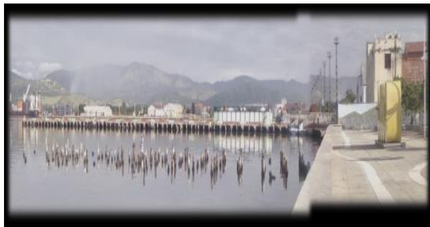
Figura 13. Punto de muestreo 11. El Espigón del muelle Romero

La figura 13 representa el onceso punto de muestreo, el cual se ubica en el Espigón del Muelle Romero del puerto Guiller món Moncada. Se obtuvieron muestras claras y transparentes, con un pH similar al reportado hasta el momento. Los contenidos de nitrito y de amonio se mantiene con valores menores a 1 mg/L, aunque en esta ocasión el nitrato y el fosfato se encuentran alrededor de 1,5 mg/L.