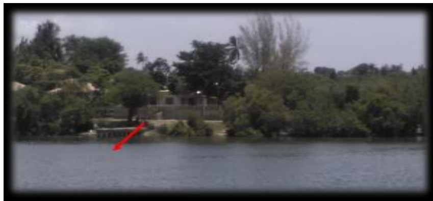
Figura 5. Punto de muestreo 4. Barrio Técnico

El punto 4 se encuentra en el atracadero de lanchas del Barrio Técnico. Cerca se observa una cafetería, algunas viviendas y una zona baja donde hay numerosos cangrejos. No se notan descargas líquidas de ningún tipo al mar y las muestras fueron claras y transparentes (figura 5).