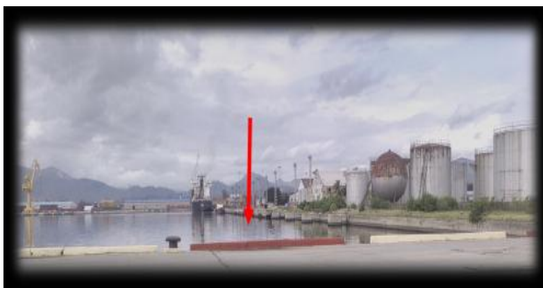
Figura 11. Punto de muestreo 9. Puerto Guiller món Moncada

El punto de muestreo 10 se ubica en el muelle de Los Cangrejos, próximo al restaurante El Ranchón, donde se encuentran atracadas numerosas embarcaciones pequeñas. En las cercanías descarga el Dren trocha, al cual vierten sus residuales, una parte del Distrito 26 de Julio y del Distrito Antonio Maceo. Las muestras se toman desde una de las embarcaciones y se presentan claras y transparentes (figura 12). Los valores reportados en este punto de muestreo (tabla 2), revelan el pH con cifras de 8,23 unidades, valores de nitrito, amonio y fosfato inferiores a 1 mg/L, mientras el nitrato vuelve a superar los 2 mg/L.