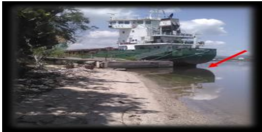
Figura 7. Punto de muestreo 6. Fábrica de Cemento José Mercerón