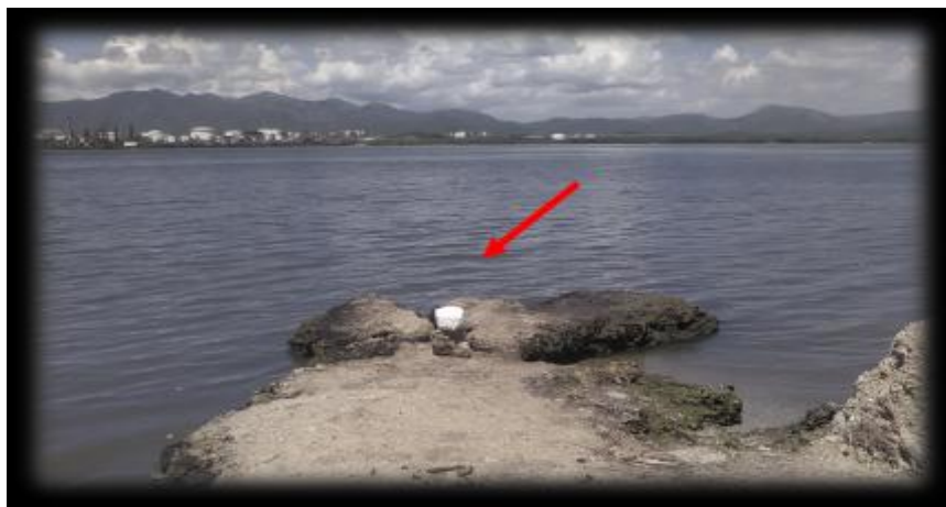
Figura 10. Punto de muestreo 8. Punta Los Cocos

En la tabla 2 se puede observar que el pH es similar al punto de muestreo anterior y a los mostrados en los cinco puntos de la entrada de la Bahía. El amonio continúa con valores muy bajos (menor de 1 mg/L), y en este caso el nitrito, el nitrato y el fosfato reportan valores de 1,39; 2,36 y 1,51 mg/L respectivamente.