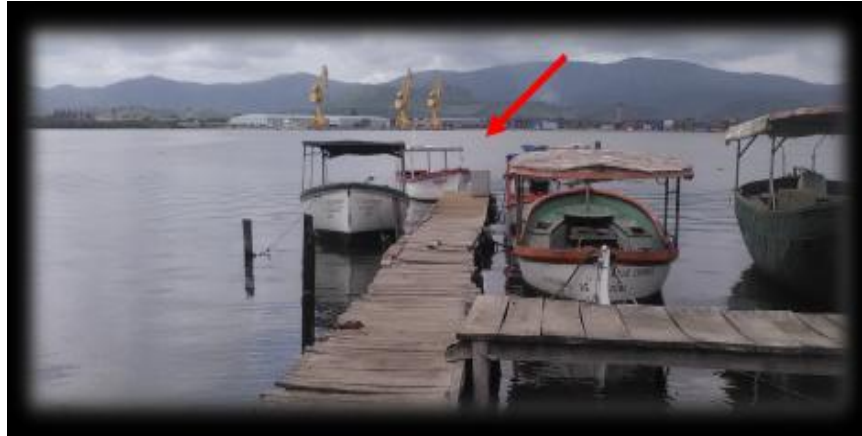
Figura 12. Punto de muestreo 10. Muelle Los Cangrejitos

En esta ocasión, el oxígeno disuelto desciende nuevamente, esta vez hasta 2,1 mg/L, la turbiedad es baja (0,81 NTU), sin embargo, los sólidos suspendidos alcanzan los mayores valores reportados entre todos los puntos de muestreos (663 mg/L). La DBO 5 y la DQO se elevan con respecto al punto anterior con valores de 83,5 y 256 mg/L respectivamente. Los resultados alcanzados en este caso pueden deberse a los diversos vertimientos que se producen en la zona.