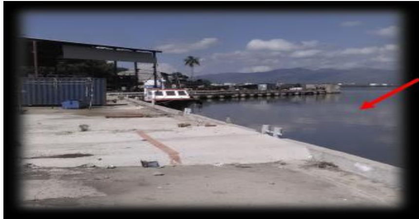
Figura 9. Punto de muestreo 7. Astillero, Fábrica de Harina No.13

En esta ocasión el pH se eleva hasta 8,82 unidades (ligeramente alcalino), las concentraciones de nitrito y amonio continúan inferiores a 1 mg/L, mientras el nitrato alcanza 1,7 mg/L y el fosfato supera los 2 mg/L.