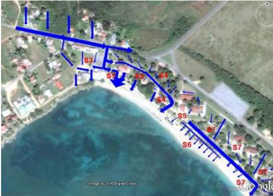
Figura 3. Sectores de escorrentías predominantes en el drenaje natural de la playa Rancho Luna